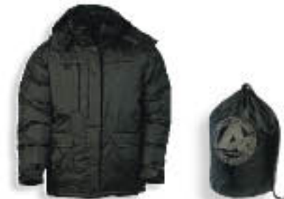
90 Fekete A dzsekihez tartozik egy zsák.

Levehető, állítható kapucni. Polár-bélelt gallér. 2 tépdzárás első zseb és 2 cipzározható oldalzseb. Cipzározható mellzseb, fülhallgató kivezetőnyílással. Cipzáros zseb az ujjon. 4 belső zseb, kettő cipzáros. Állítható mandzetta szélesség. Zsinórral szabályozható derékrész. Cipzározható javítónyílás, hozzáférés hímzeteléshez. Poliamid zsák a kabátéhoz.