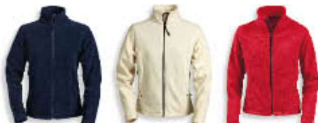
15 Matrózkék 52 Krém 81 Piros