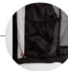
Belső hálsó zseb síszemüvegnek.