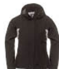
90 Fekete/ Világos szürke