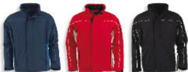
15 Matrózkék/Királykék 81 Piros/Krém 90 Fekete/Törtfehér

2 oldalzseb, 2 mellzseb, 1 zseb az ujjon és 1 belsőzseb, mindegyik cipzározható. Állítható mandzetta szélesség. Teljesen szabályozható kapucni, mely elrejthető a nyakrészben. Cipzározható javítónyílás, hozzáférés hímzeteléshez.