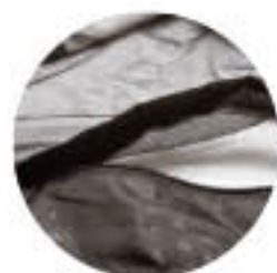
Cipzárózható javítónyílás a belésen, hozzáférés nyomtatáshoz, hőmérsékletéhez.