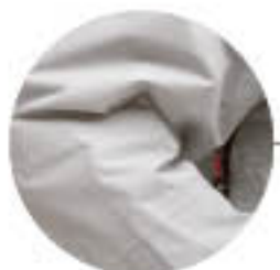
Kerekített könyök rész.