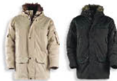
54 Khaki 90 Fekete

2 első zseb, 2 mellzseb, 2 oldalzseb, 4 belsőzseb és 1 hátsó zseb, mindegyik cipzározható. 2 zseb az ujján. Levehető műszörme a kapucnin. Állítható mandzetta szélesség. Belső, rugalmas ujjpasszé. Cipzározható javítónyílás, hozzáférés hímzeteléshez.