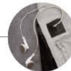
Belső "Napoleon" zseb fülhallgató kivezetővel.