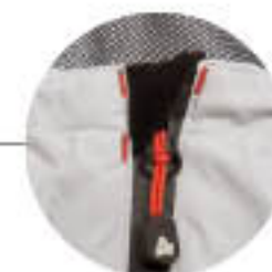
A cipzár cipzárfejjel zárul.