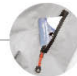
Síbéllet tartó zseb a kabátujjon.