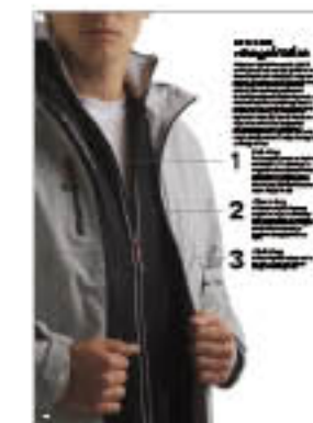
Az A-Code rétegelmélet.