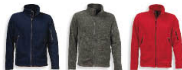
15 Matrózkék 53 Antracit márga 81 Piros