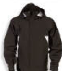
90 Fekete/ Világos szürke