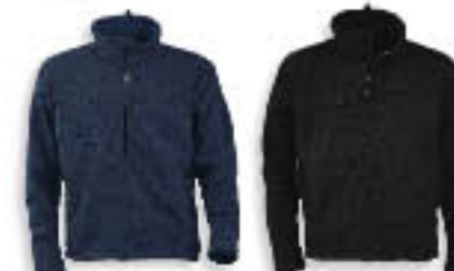
15 Matrózkék 90 Fekete

2 oldalzseb, 1 mellzseb és 1 belsőzseb, mindegyik cipzározható. Állítható nyakrész és zsinórral szabályozható derékrész. Méretek • XS - 2XL Anyag • 100% poliészter, micropolár, laminált PU.