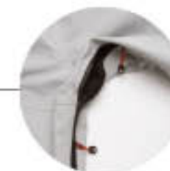
Szellőző nyílás a hónaljrésszen.