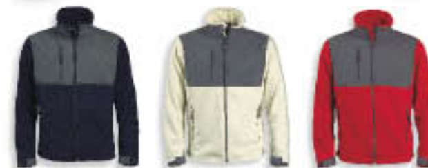
15 Matrózkék/Szürke 52 Krém/Szürke 81 Piros/Szürke